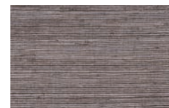
JAPAN MARINE 20x31,6x0,9 cm P3149883 / 100160372 G205

Butech recomienda junta / Butech recommends joint: : Colorstuk Rapid n Gris B21522258/100236834 Colorstuk O-4 Blanco n B21522237/ 100236442