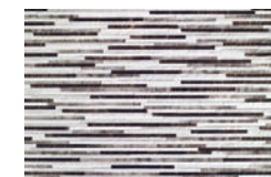
JERSEY MIX 20x31,6x0,9 cm P3149983 / 100105160 G222

Butech recomienda junta / Butech recommends joint: Colorstuk Rapid n Gris B21522258/100236834