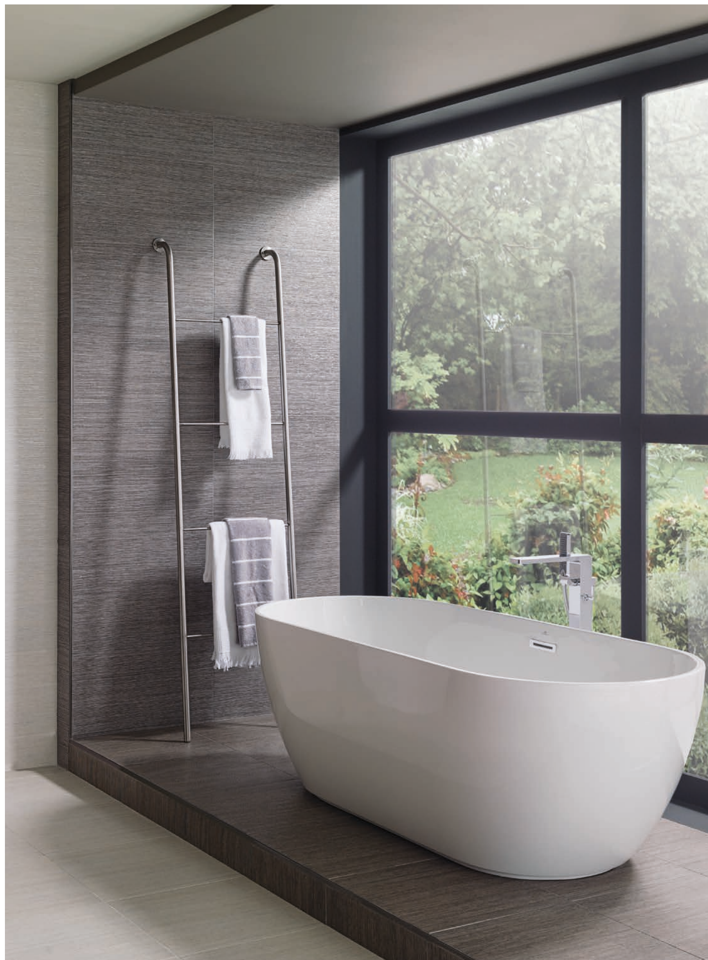
REVESTIMIENTO: JAPAN BLANCO 31,6x59,2cm | PAVIMENTO: JAPAN BLANCO 44,3x44,3cm | JAPAN MARINE 44,3x44,3cm