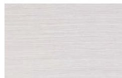
JAPAN BLANCO 20x31,6x0,9 cm P3149882 / 100160371 G205

Butech recomienda junta / Butech recommends joint: : Colorstuk Rapid n Gris B21522258/100236834 Colorstuk O-4 Blanco n B21522237/ 100236442