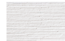
JERSEY NIEVE 20x31,6x0,9 cm P3149984 / 100105162 G222

Butech recomienda junta / Butech recommends joint: Colorstuk Rapid n Gris B21522258/100236834